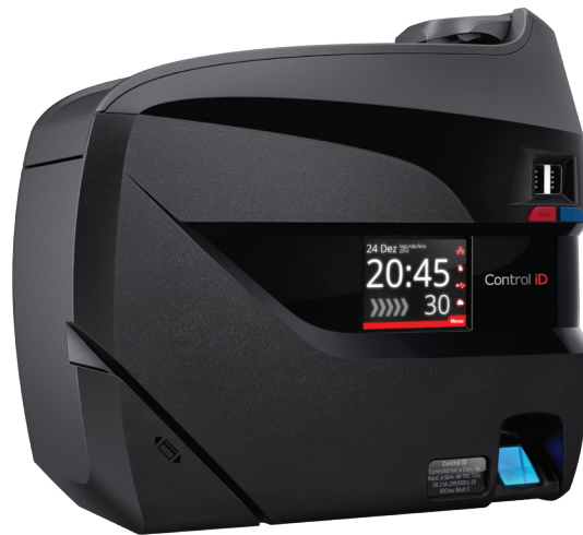
TABELA DE MODELOS